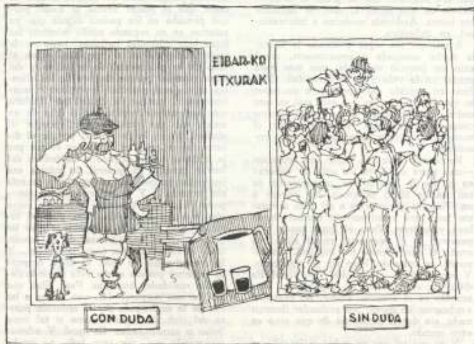
Sobre la huelga del uchiquiton.