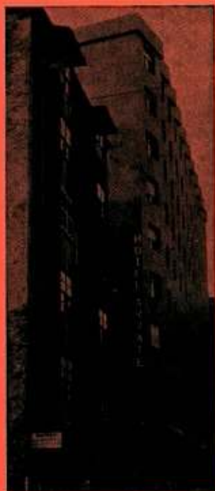
El nuevo hotel (pág. 10)

Redacción y Administración: Bidebarrieta, 11