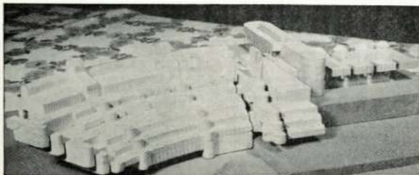
Maqueta de la RESIDENCIA DE ANCIANOS