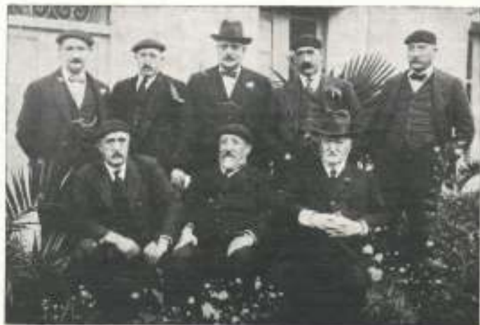
Componentes de la familia Orbea