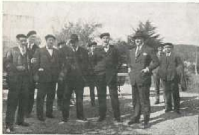
El pintor Zuloaga con amigos eibarreses