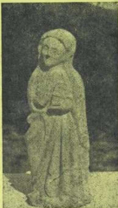
Imagen del siglo XV EN ZOZOLA

una opinión SOBRE EL MUSEO DE ARTE EIBARRES