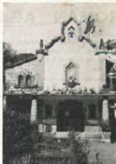
Esta capilla será derribada.

Se empezó por diseñar un proyecto para una nueva Residencia de Ancianos. Los miembros de la Junta se sentían impulsados a ello por la realidad imponente de que el Asilo-Hospital era viejo, bastante inadecuado y totalmente insuficiente. El proyecto, en consecuencia, se redactó y se aprobó. Así empezaba la aventura de una construcción nueva.