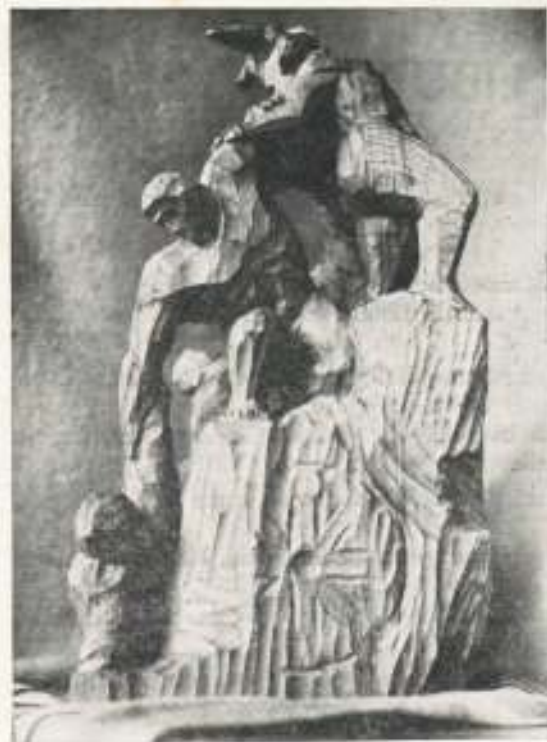
«La paz es obra de todos», Talla expuesta en Bilbao.

Desde el 21 al 31 de Diciembre último, Paulino ha presentado en la Galería Windsor de Bilbao 32 obras suyas. La crítica del numeroso público que visitó su Exposición ha sido sumamente elogioso. Un nuevo éxito, merecidísimo ciertamente, el de nuestro artista eibarrés, a quien J. J. Eizaguirre entrevista para "El Correo Español" y de donde transcribimos lo siguiente.