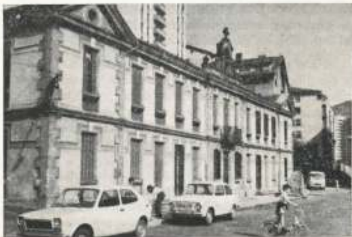
Fachada del viejo Hospital.

Eibar, que siempre se ha volcado por su Hospital, se volcará también ahora en esta obra tan benemérita y, no lo dudamos, surgirán "ladrillos" por todas partes. Estos "ladrillos" y la voluntad tenaz de tantas gentes altruistas como viven en este Eibar querido harán posible esta realización.