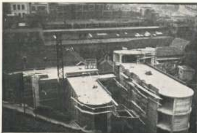
Las obras de la 1.ª fase.

Se construirá un cuerpo central dedicado a administración y uso público. Aquí irá una planta cuadra-