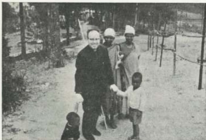
En la verde Rwanda.

A Rwanda la llaman el "país de las mil colinas". Es también el "país de los cinco volcanes y de los veintitrés lagos" y numerosos ríos, entre los cuales descuella el Nyabarongo, uno de los afluentes del Nilo.