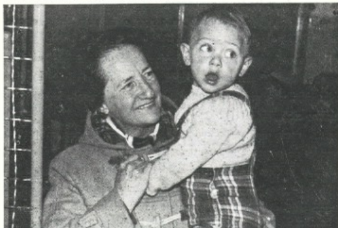
La artífice de la Sociedad Femenina.

Desde aquí nos quitamos la txapela, les volvemos a felicitar y les agradecemos cuanto hacen, en nombre de todos los necesitados de Eibar y Guipúzcoa.