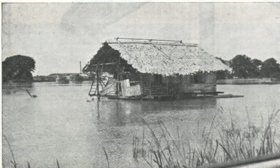
Una mirada te espera

Las Misiones Diocesanas nos permiten abrirnos a formas más universales de amor y de servicio que las que podemos vivir aquí. Esto no nos empobrece humanamente ni disminuye nuestra capacidad de comprometernos con nuestros problemas más próximos e inmediatos.