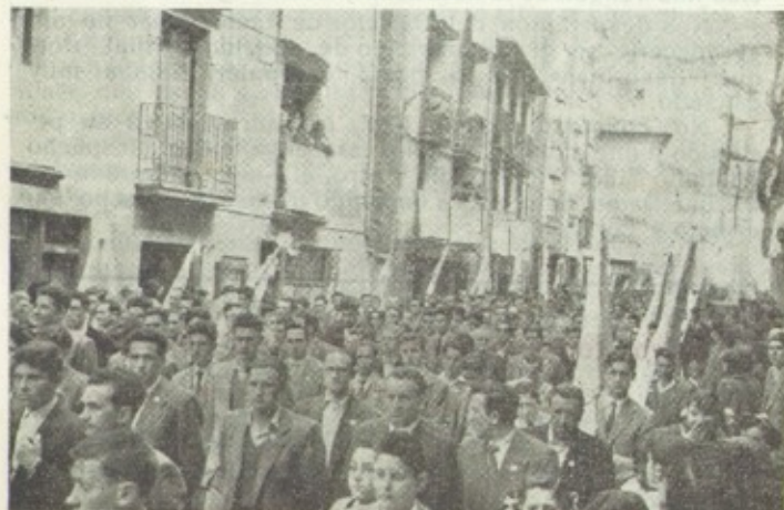
Jóvenes guipuzcoanos honrando a la Virgen de Arrate