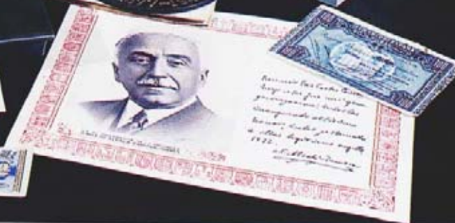
PATRONATO DE DON NICETO ALCALÁ ZAMORA.