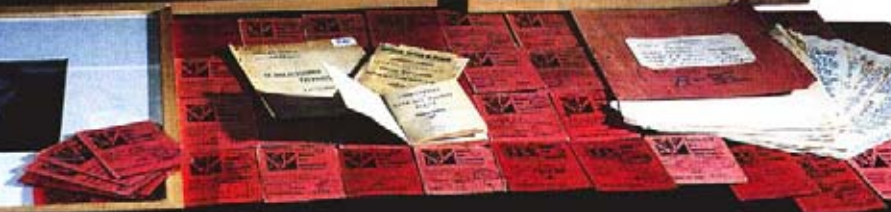
MINISTERIO DE EDUCACIÓN CULTURA Y DEPORTE. ARCHIVO GENERAL DE LA GUERRA CIVIL ESPAÑOLA.