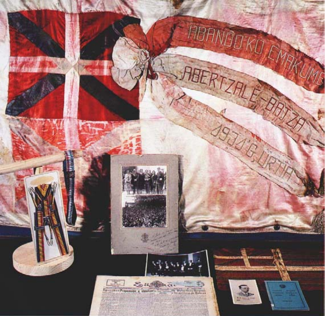
SABINO ARANA KULTUR ELKARGOA. ABERTZALETASUNAREN MUSEOA ETA AGIRITEGIA.