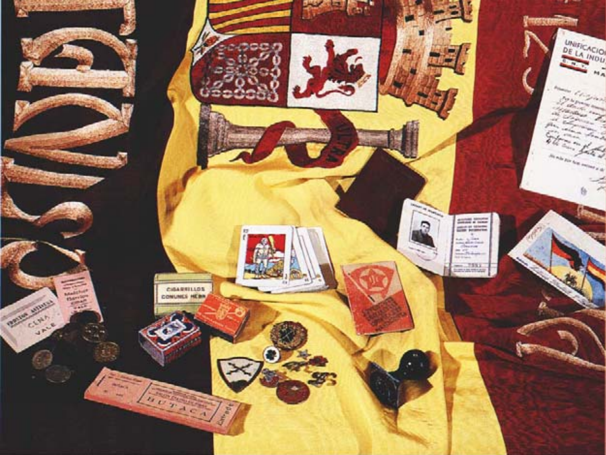
SOCIEDAD DE AMIGOS DE LAGUARDIA ALAVA BIASTERIREN ADISKIDE ELKARTEA ARABA.