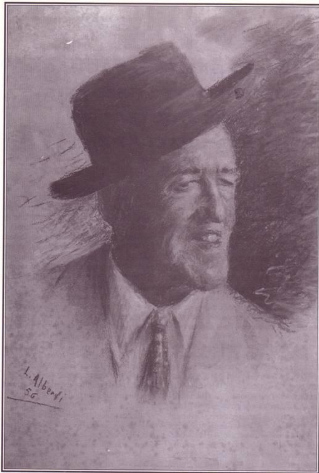
"Pedrutxo". Lucas Alberdiren dibujoa.