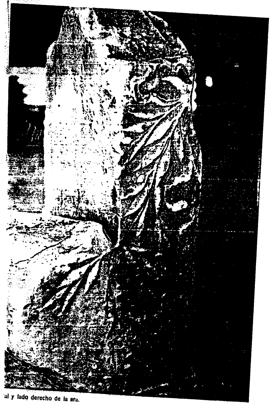
al y lado derecho de la ara.