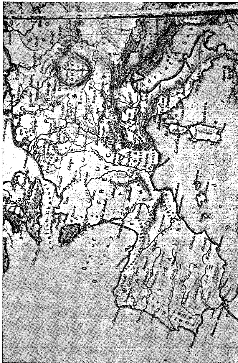
Mapa de las lenguas indo-europeas