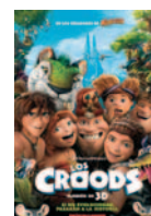
LOS CROODS: UNA AVENTURA PREHISTÓRICA