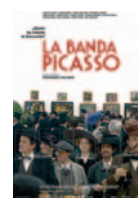
LA BANDA PICASSO