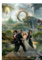
OZ: UN MUNDO DE FANTASÍA