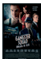
GANGSTER SQUAD (BRIGADA DE ÉLITE)