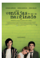
LAS VENTAJAS DE SER UN MARGINADO