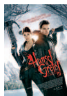
HANSEL Y GRETEL: CAZADORES DE BRUJAS