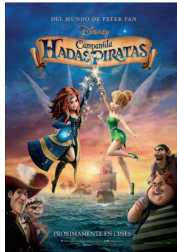
CAMPANILLA: HADAS Y PIRATAS

EGITARAUAN ALDAKETAK EGON DAIZTEKE. ORDUTEGI ETA ARETOEI BURUZKO INFORMAZIOA KARTELERAN PROGRAMACIÓN SUJETA A CAMBIOS. PARA HORARIOS Y SALAS CONSULTAR CARTELERA