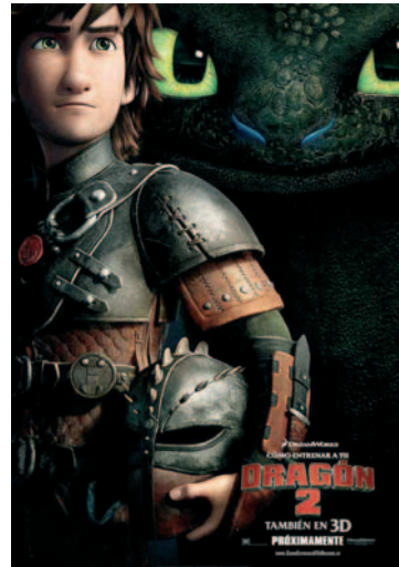
CÓMO ENTRENAR A TU DRAGÓN 2