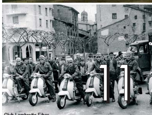
Club Lambretta Eibar