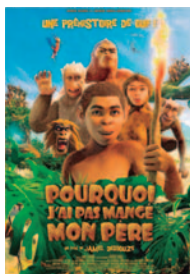
EL REINO DE LOS MONOS (EUSKERA, CASTELLANO)