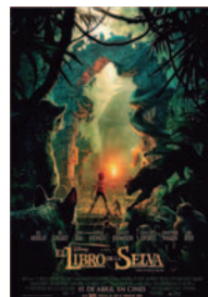
EL LIBRO DE LA SELVA