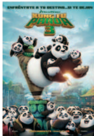
KUNG FU PANDA 3