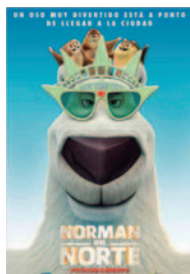
NORMAN DEL NORTE (EUSKERA, CASTELLANO)