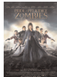
ORGULLO Y PREJUICIO Y ZOMBIS