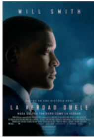
LA VERDAD DUELE