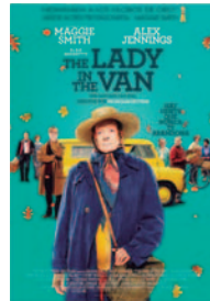
THE LADY IN THE VAN