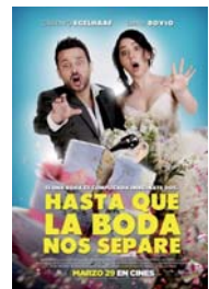
HASTA QUE LA BODA NOS SEPRE