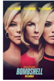
EL ESCÁNDALO (BOMBSHELL)