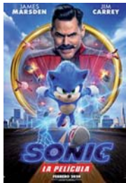
SONIC, LA PELÍCULA