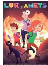
LUR ETA AMETS

EGITARAUAN ALDAKETAK EGON DAITEZKE. ORDUTEGI ETA ARETOEI BURUZKO INFORMAZIOA KARTELERAN PROGRAMACIÓN SUJETA A CAMBIOS. PARA HORARIOS Y SALAS CONSULTAR CARTELERA