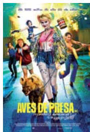
AVES DE PRESA