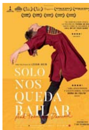
SOLO NOS QUEDA BAILAR