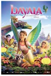
BAYALA: UNA AVENTURA MAGICA