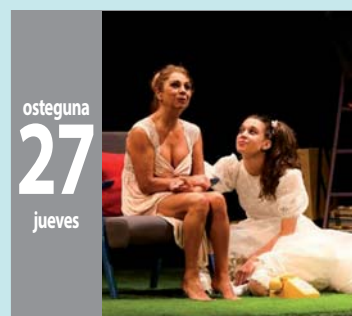
ANTZERKI JARDUNALDIAK JORNADAS DE TEATRO hitzaldia - conferencia