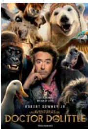
LAS AVENTURAS DEL DOCTOR DOLITTLE