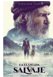
LA LLAMADA DE LO SALVAJE