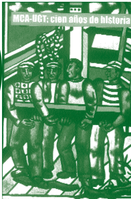
Les constructeurs, 1950. Fernand Léger