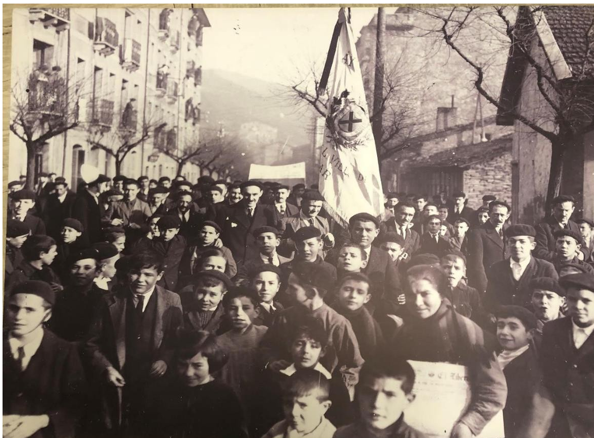
Eibartarrak Marokoko gerraren aurka.

Telleriak oso garai gorabeheratsua eta gatazkaz betea bizi izan zuen lehenengo agintaldian, bai maila politikoan bai ekonomiko eta sozialean: Espainia Marokoren kontrako gerran sartuta zegoen, eta Eibarren manifestazio handiak egin ziren haren aurka.