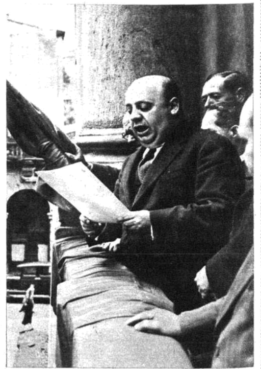
El ministro de Hacienda, don Indalecio Prieto, leyendo el decreto que concede el título de "Ciudad Muy Ejemplar" a la villa de Eibar, desde el balcón del Ayuntamiento