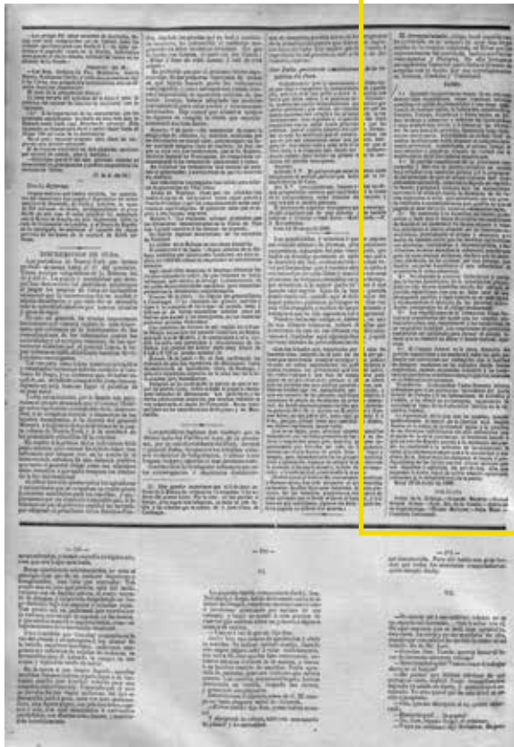
Yrurac bat Diario político de Bilbao . Eibarko Itun Federalaren idazkia, 1869ko ekainaren 27an kaleratua. ( www.katalogoak.euskadi.eus )

1492 arte Gaztelaren he- dapenaren ondorioz finkatutako erresuma eta probintzietako ordezkari- ak bildu ziren –Extre- madura, Murtzia eta bi Andaluziak–, bien bitar- tean A Coruñan sustrai gutxi samarreko bilkura bat egin zen Galiziako antzinako erresumaren eta Asturiaseko printze- rriaren artean. Beste kasu batzuetan gertatu zen bezala –adibidez 1808an Batzorde Zentrala osatu zenez–, antzinako konstituzioak birsortu nahi zirenean lurralderik arazotsuena Gaztelakoa izan zen. Valladoliden ha- mazazpi probintzia bildu ziren bi Estatu gaztelar- tan.