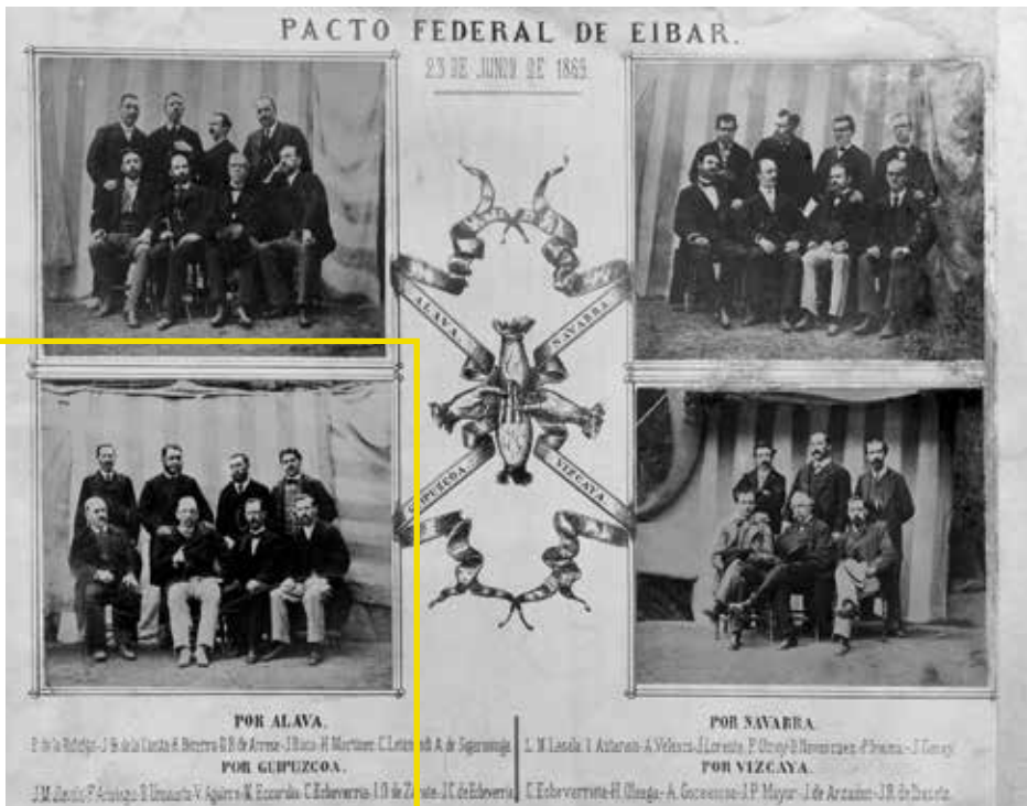
Eibarko Itun Federalaren karian kaleratutako kartela (1869).

Puntu hau funtsezkoa da federalismoan jatorri horiek geroztik: aldi berean jartzen da arreta tokiko autonomiaren zaintzan eta nazio espainiarraren eraikuntzan. Bateriaezinak izatetik urrun (oraindik iristeke zegoen nazionalismoarentzat bai izango dira), errepublikarrentzat txanpon beraren bi aldeak ziren, 80ko urteetan egiaz atzeraka zihoan alderdiarekin hautsi