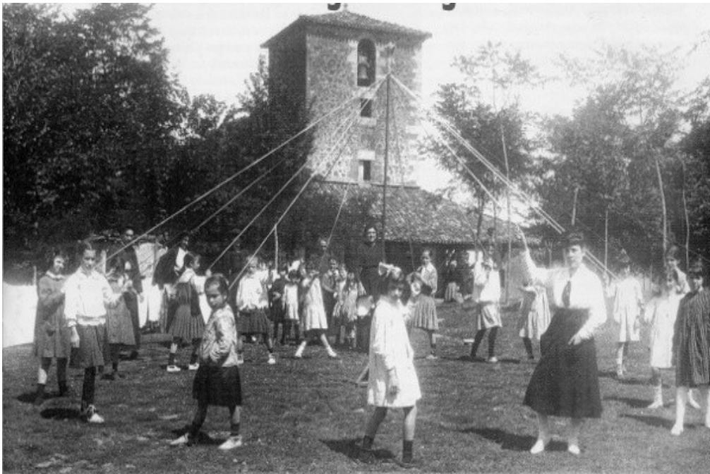
Zinta-dantza Arraten, (Eibar, Gipuzkoa), XX. mende hasieran.

Sei urte hauetan Ingalaterra, Flandria, Frantzia, Portugal, Katalunia, Valentzia, Gaztela, Galizia, Kanariak eta Euskal Herriko dantzak ikusteko aukera eskaini du Ezpalak jaialdiak. Baina euren arteko aldeak baino gehiago, kultura koreografiko horien guztien arteko antzekotasunak nabarmentzeko ahalegina da Ezpalak. Izan ere, folkloreak herrien arteko loturak aspaldikoak direla erakusten digu, eta dantza tradizionalak Europako eskualdeen arteko trukea frogatzeko era hobezina dira.