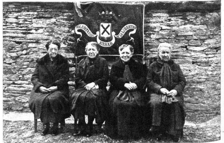
Las cuatro señoras que bordaron la bandera republicana de los Voluntarios de la Libertad de Eibar en 1870, que fué llevada a Bilbao por un voluntario superviviente con motivo de la fiesta del 2 de Mayo