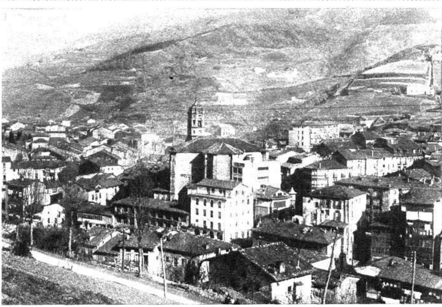
Vista parcial de Eibar, a la que el Gobierno de la República ha concedido el título de "Ciudad Muy Ejemplar", con motivo de haber sido la primera población española que proclamó el nuevo régimen