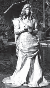
UNTZAGA PLAZA ETA TORIBIO ETXEBARRIA KALEA